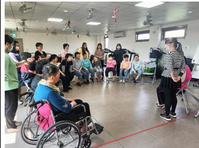
人際關係成長計劃